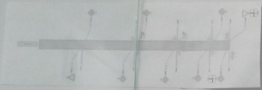
СХЕМА БЕЗОПАСНОГО ДВИЖЕНИЯ УЛ. ЛЕНИНА